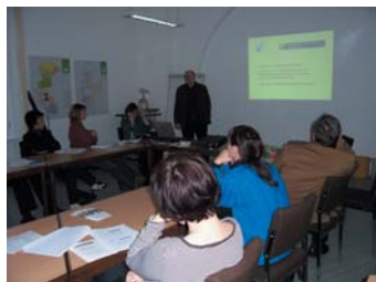
Seminar April 2008